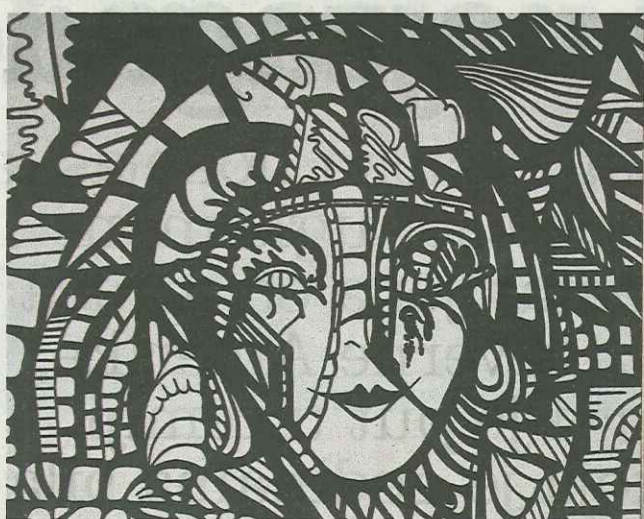
'U mom životu nema sive. Kod mene je sve u ekstremima', ističe Maja Vržina i objašnjava da su baš zbog toga njezine slike crno-bijele

ranja, dovodeći svoja djela do željene perfekcije, a sada željno iščekuje reakciju vanjskog svijeta. Uključujući kritiku, govori. Majin život, osim ekstremima, ispunjen je potragom.